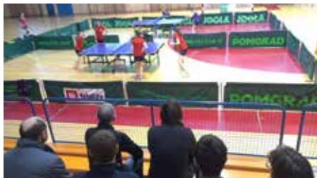
pogled na tekmo v II. SNTLŽ