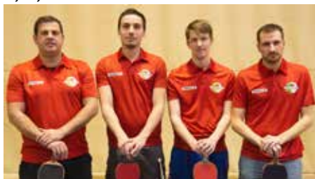
moška članska ekipa