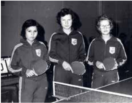
Škerget, Vergan, Zver so bile v sedemdesetih del članske ekipe, ki je igrala v I. slovenski ligi