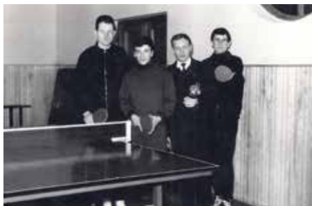
Prva članska moška klubska ekipa v sezoni 1965/66 v sestavi Fridrih, Žekš, Unger-trener in Žižek.