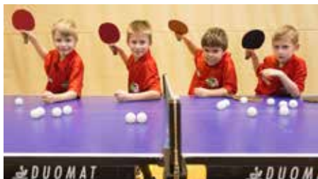
najmlajši člani kluba