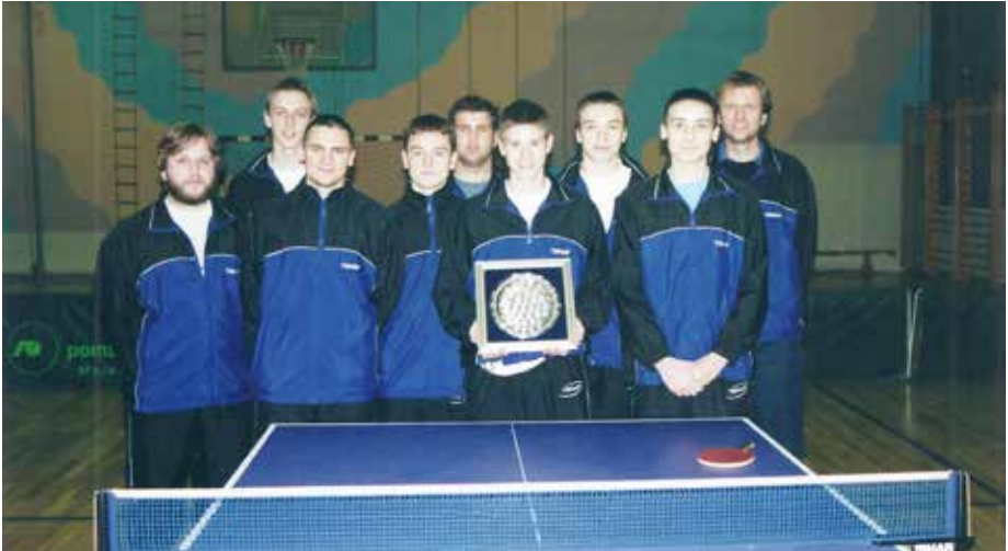
Plaketa za najboljši športni kolektiv v MO Murska Sobota

Večkrat smo bili med najboljšimi tremi športnimi kolektivi v MO Murski Soboti in tudi nekaj posameznikov je bilo nagrajenih z uvrstitvijo med najboljše tri športnike MO Murska Sobota.