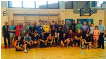
Sodelujoči na 1. Memorialnem turnirju