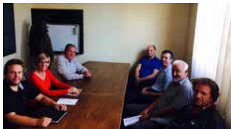
Ožji organizacijski odbor za pripravo praznovanja in del sedanjega upravnega odbora