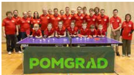
člani NTK Sobota