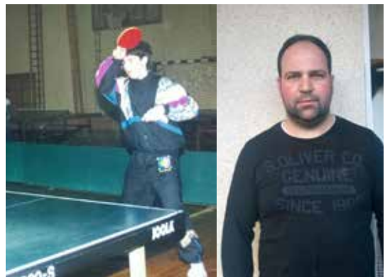
Miran Solar kadetski prvak Slovenije v sezoni 1993/94 in slovenski kadetski reprezentant