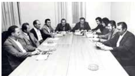
Upravni odbor kluba nekoč